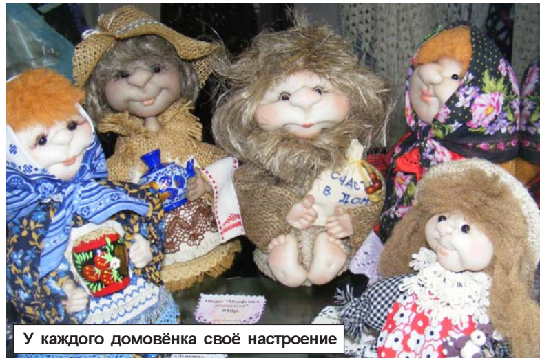
У каждого домовёнка своё настроение

Мастера сами называют цену своим работам, и она, как правило, невысокая. Причина - низкая покупательская способность населения нашего города. А вот во