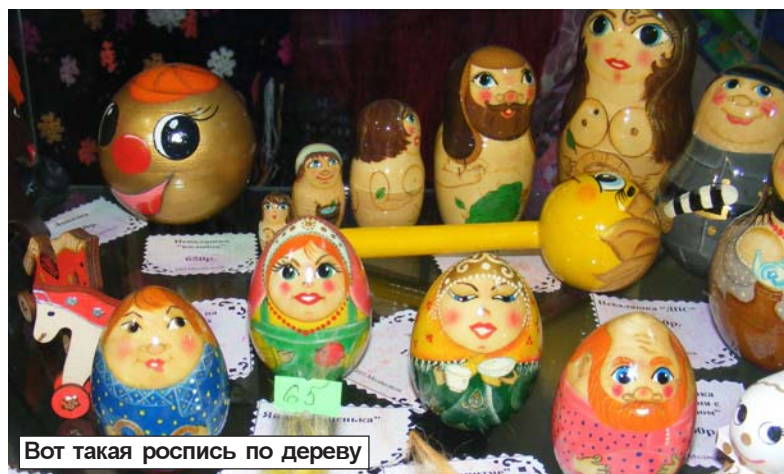
Вот такая роспись по дереву

всем мире изделия ручной работы стоят гораздо дороже, чем аналогичные промышленные товары. Есть ли смысл творческим людям тратить на материалы, корпеть над вышивкой, утомлять глаза бисероплетением, а руки - валянием шерсти?